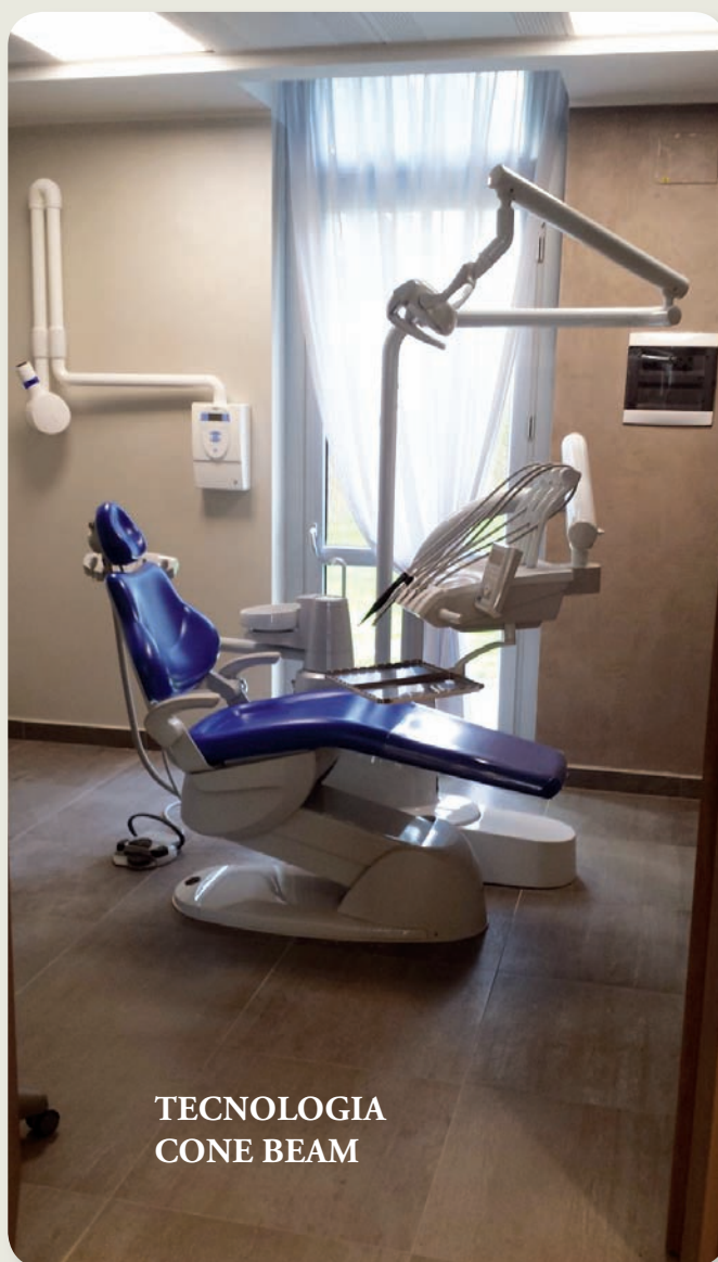
TECNOLOGIA CONE BEAM

Le prestazioni odontoiatriche si avvalgono dell'utilizzo di nuova tecnica di Tomografia Computerizzata dedicata allo studio del massiccio facciale, in particolare delle arcate dentarie, nella valutazione e programmazione di interventi di implantologia. La tecnologia CONE BEAM utilizza un fascio di raggi X di forma conica che consente di acquisire un ampio volume con notevole riduzione di radiazioni a cui si espone il paziente rispetto ai convenzionali sistemi TAC.